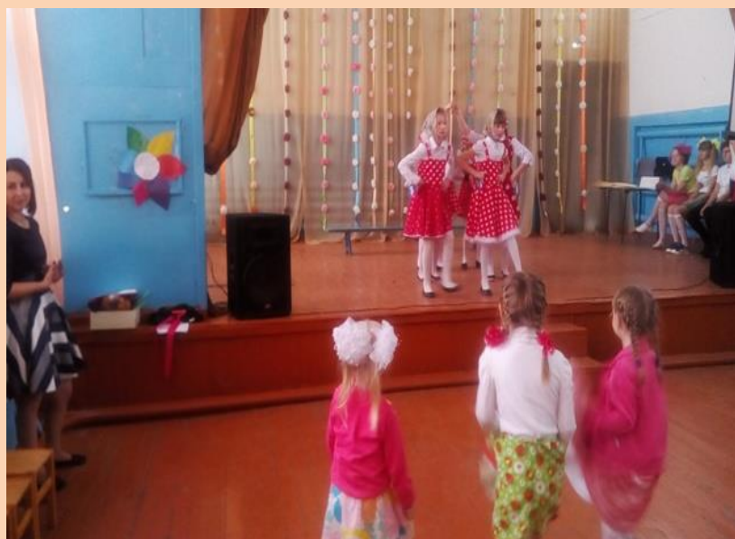
Танец «Валенки» в исполнении учеников 4 класса...и «группой поддержки» из детского сада

Самым лучшим из женщин Мы пожелать хотим Счастья, улыбок и нежности, Мы Вас очень любим!