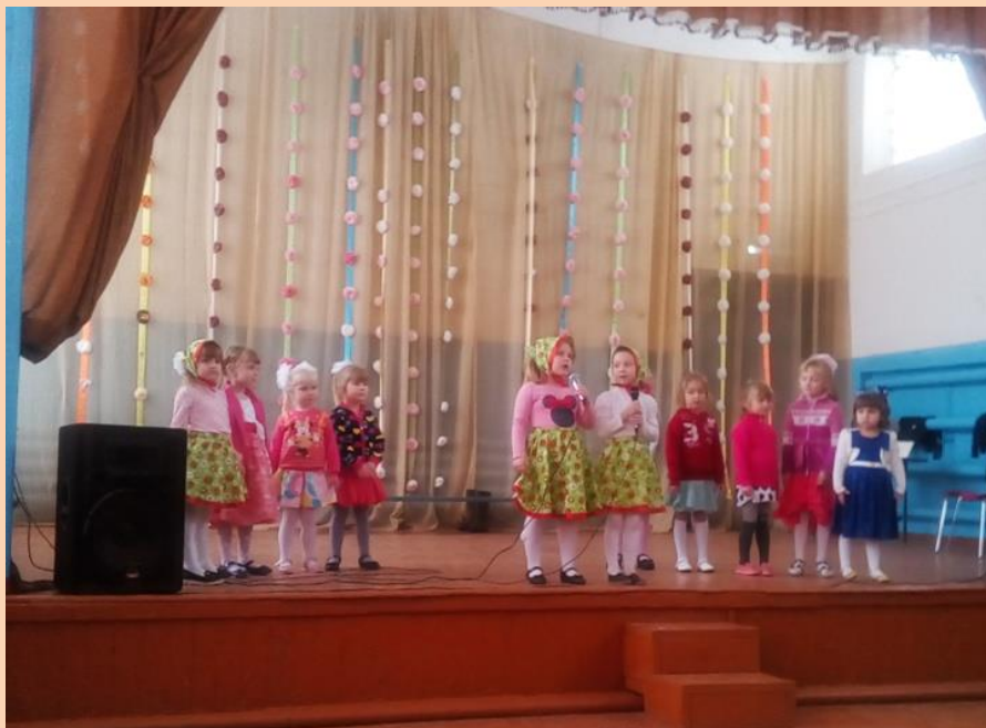
Песня о любимой маме - поют воспитанники детского сада

Самым любимым на свете Мы пожелать хотим Теплого солнечного света, Счастливых лет и зим.